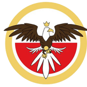
Polska Liga Quidditcha