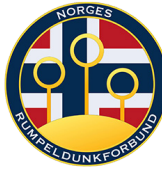
Norges Rumpeldunk- forbund